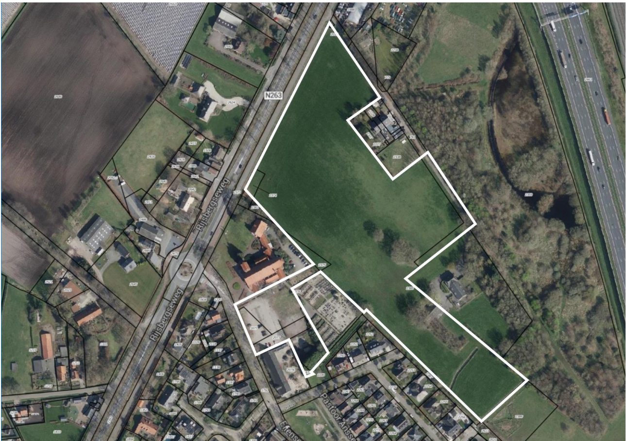
Plangebied in-/uitbreiding Effen

Het plangebied ligt deels buiten de bebouwde kom van Effen en voor een klein deel erbinnen. Onderstaande luchtfoto met omkadering van het beoogde plangebied geeft weer hoe de locatie is gelegen.