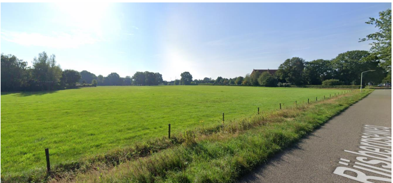
Zicht op noordoostkant Effen